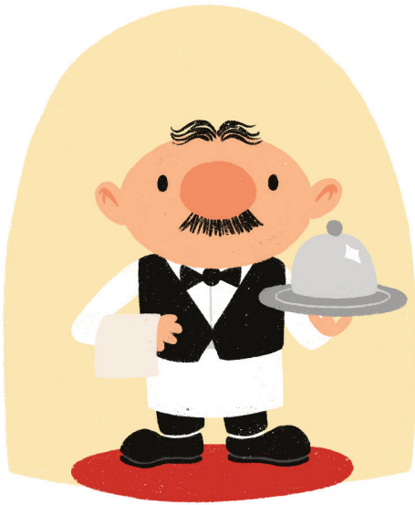
Conoce a Hanz