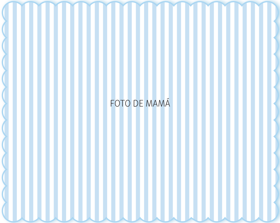
FOTO DE MAMÁ