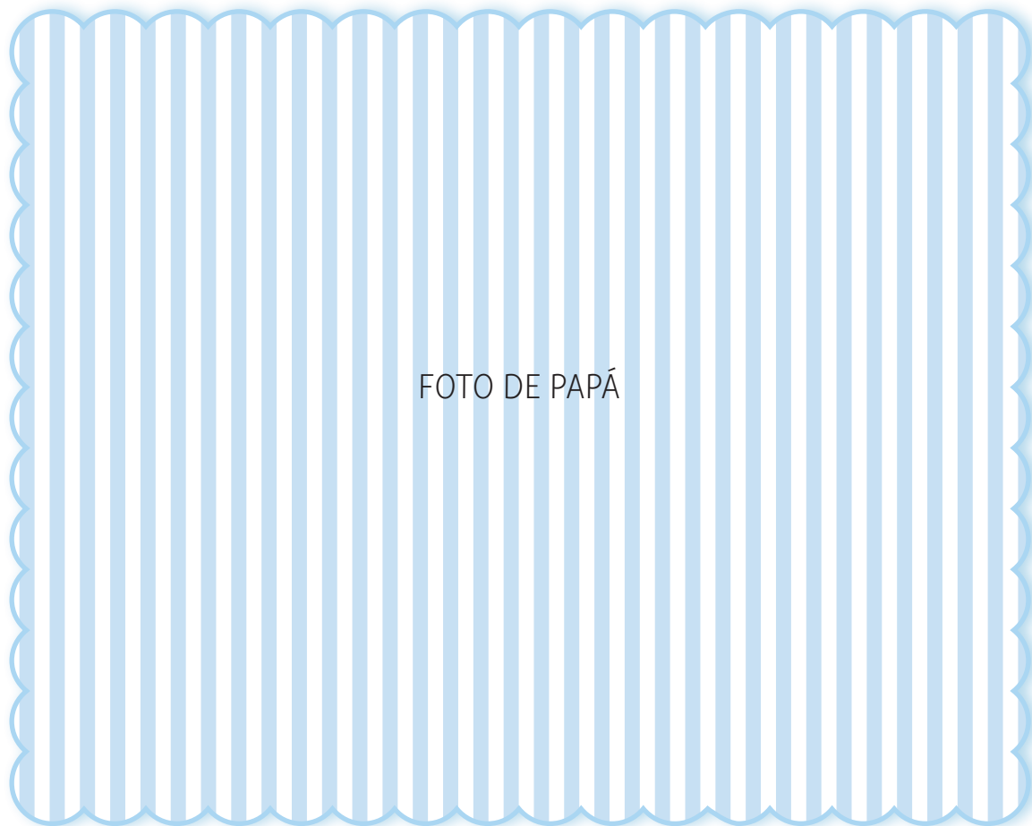
FOTO DE PAPÁ